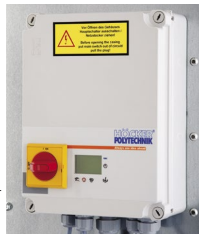
Ilustracja po prawej: Sterowanie SPS z wyświetlaczem oraz trwałą, foliowaną klawiaturą.