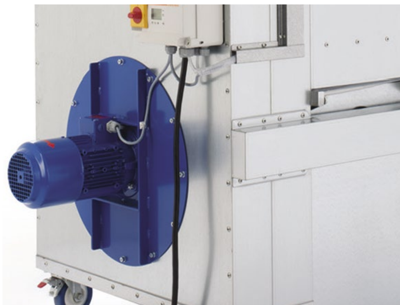
Ilustracja górna: Vacumobil VT 160 z silnikiem energooszczędnym 2,2 kW (IE3)

Technicznie zaawansowane wnętrze obudowy, jak również standardowo montowane energooszczędne napędy (IE3) skutkują zwiększoną sprawnością odciągową i zmniejszonym poborem prądu. Jednocześnie dwa przejezdne zbiorniki na wióry oferują większą przestrzeń użytkową. Przez co VACUMOBIL gwarantuje energooszczędną pracę, nadzwyczaj przyjazną dla środowiska. Sprawą oczywistą jest, że wszystkie urządzenia są przetestowane przez stowarzyszenie zawodowe zgodnie z normą GS-07 H0. Pracują one wyłącznie z certyfikowanym materiałem filtracyjnym wg BG i posiadają znaki jakości H3/GS.