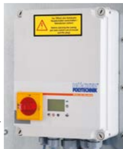
Ilustracja po prawej: Sterowanie SPS z wyświetlaczem oraz trwałą, foliowaną klawiaturą.