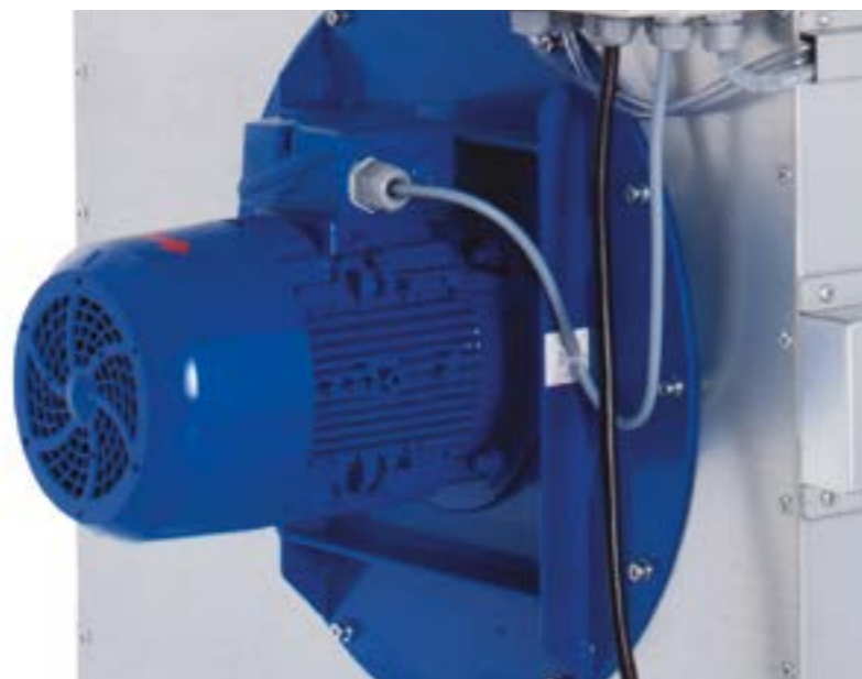
Ilustracja górna: Vacumobil VT 200 z silnikiem energooszczędnym 4,0 kW (IE3)